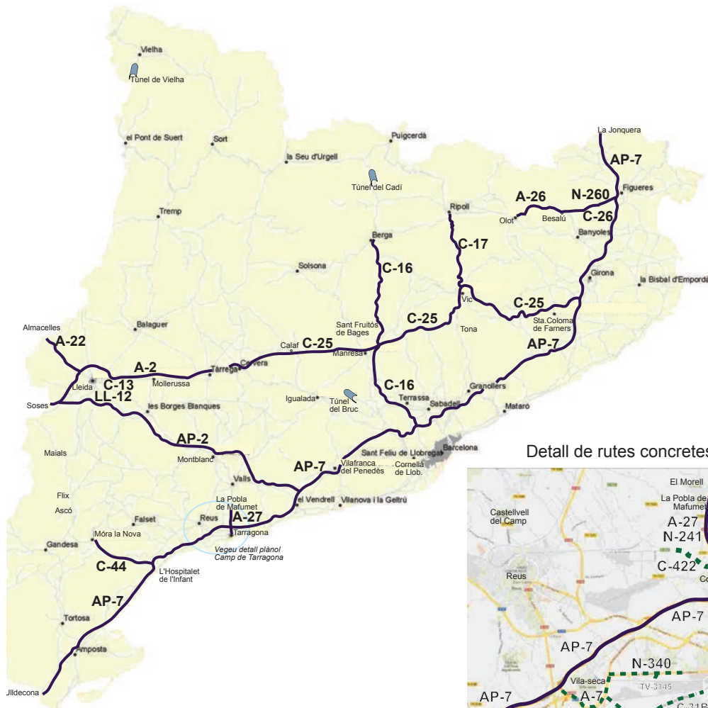
Detall de rutes concretes Camp de Tarragona