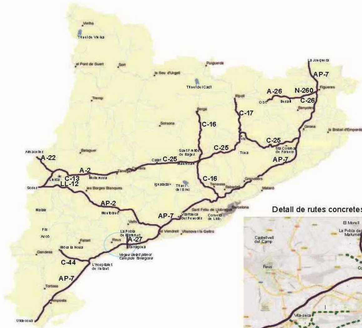
Detall de rutes concretes Camp de Tarragona